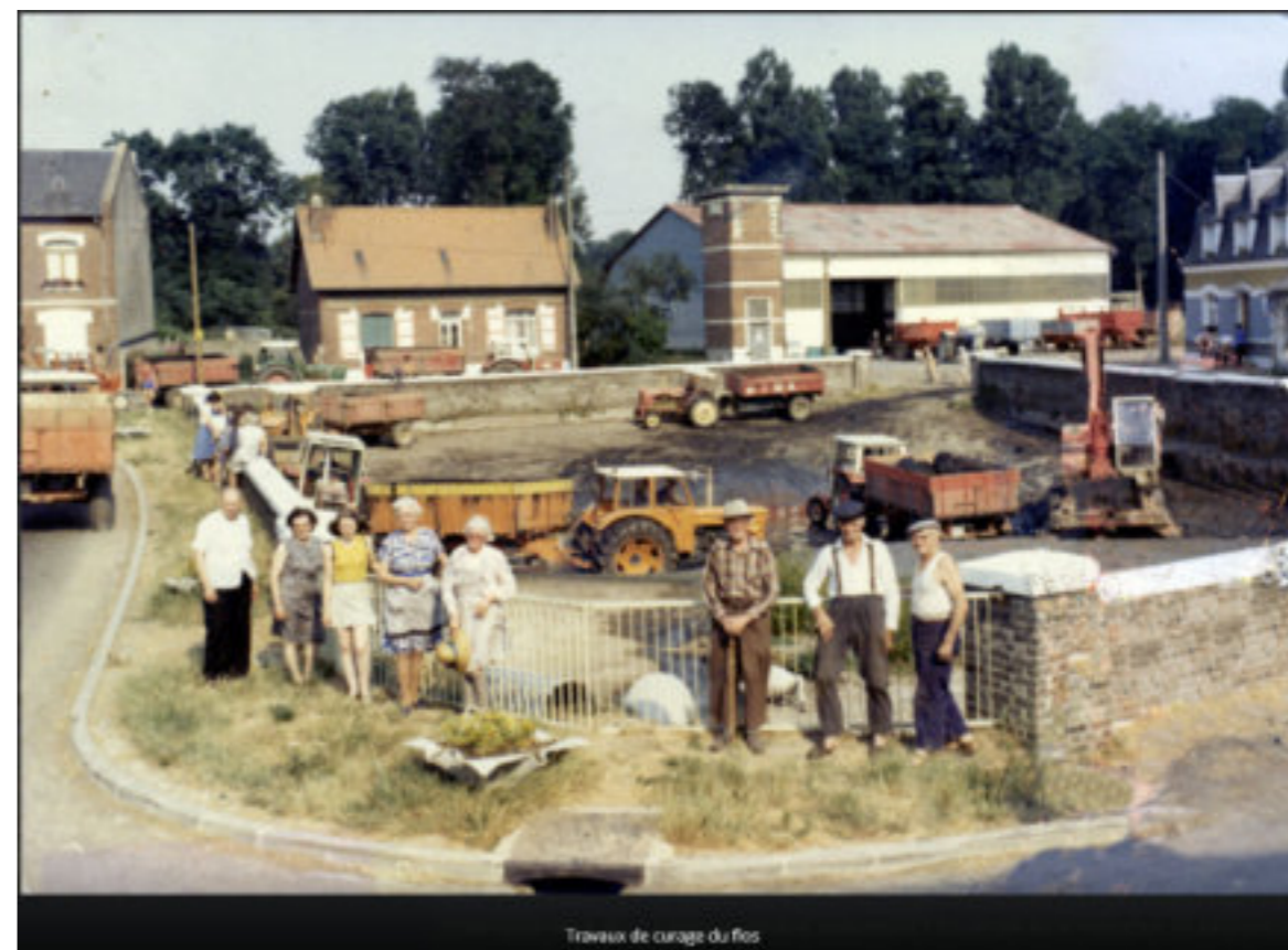
Travaux de curage du foss